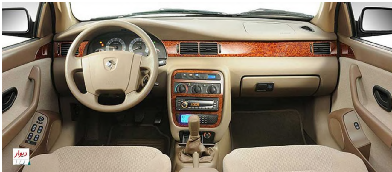
نمای داخلی خودرو سمند

در کنار این برندها ، می توانید مارک های دیگری از لنت ترمز سمند سورن و لنت ترمز EF7 را نیز مشاهده نمایید که توصیه می شود حتما از فروشگاه های معتبر و با سابقه تهیه نمایید تا سلامت خودرو و سیستم ترمز سمند را حفظ نماید . همچنین برای خرید انواع لنت ترمز سمند می توانید با بخش فروش شهردیک تماس گرفته و خریدی مطمئن داشته باشید.