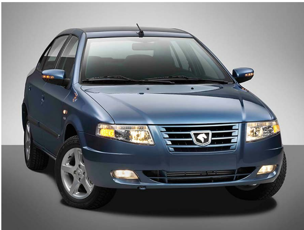
لنت ترمز سمند سورن (EF7)

خودروی سمند سورن نیز یکی دیگر از مدل های سمند است که طرفداران زیادی داشته است برای تولید این خودرو تلاش شده است تا بهترین قطعات و با کیفیتی بالا تهیه شود. در خصوص این خودرو نیز لنت ترمز های عقب شکل کاسه ای داشته و قیمت مناسب تری را به خود اختصاص می دهد که در مقایسه با لنت ترمز جلو دارای تفاوت قیمت محسوسی است .