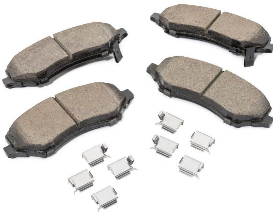
لنت ترمز سمند

از طرفی به محض مشاهده ی علائم هشدار دهنده در خصوص لنت ترمز ، بلافاصله جهت تعویض آن اقدام نمایید زیرا همان گونه که می دانید با اتمام لنت ترمز اولین قسمتی که در سیستم ترمز دچار صدمه و آسیب می شود دیسک ترمز است که به محض خرابی صدای نامناسبی را هنگام ترمزگیری ها از خود نشان می دهد .