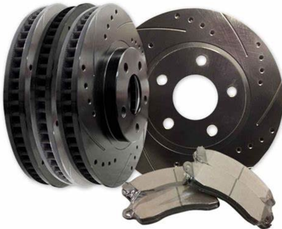
فروش عمده لنت ترمز