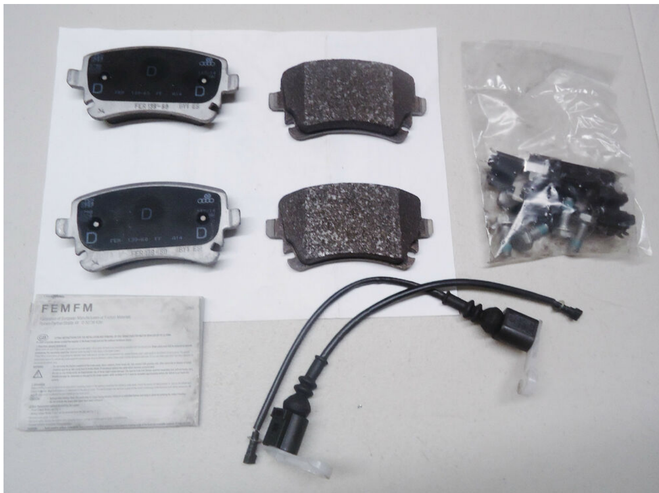
فروش عمده لنت ترمز

برای انتخابی صحیح در زمانی اندک ، پیشنهاد ما خرید از شهردک می باشد. این فروشگاه بزرگ ارائه دهنده لنت ترمز ، برند های معتبر داخلی و خارجی را به شما معرفی کرده و مطابق با نیاز خودروی شما ، لنت ترمزی مناسب را با قیمتی مناسب ارائه می دهد. در شهردک فروش لنت ترمز برند های متفاوتی همچون PGS ، پاجروقطعه ، نیک استار ، Afortis ، Hi-Q با بهترین کیفیت عرضه می شود.