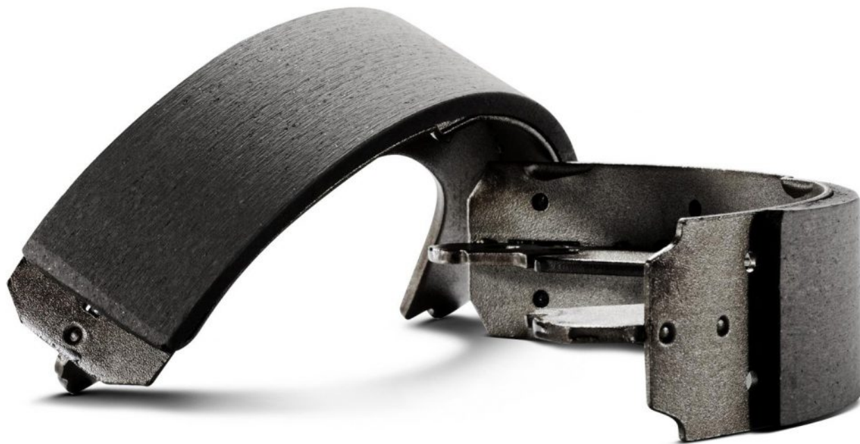
فروش عمده لنت ترمز

این قبیل لنت های ترمز برای استفاده های روزانه با سرعت معمولی مناسب هستند و دوام خوبی در دماهای پایین دارند. لنت های ترمز از نوع نیمه فلزی و یا سرامیکی می توانند گزینه ی مناسبی باشند. این گونه لنت های ترمز به دلیل کم صدا بودن بیشتر مورد انتخاب قرار گرفته اند. نوع لنت ترمز بر فروش لنت ترمز و قیمت لنت ترمز نیز تاثیر دارد