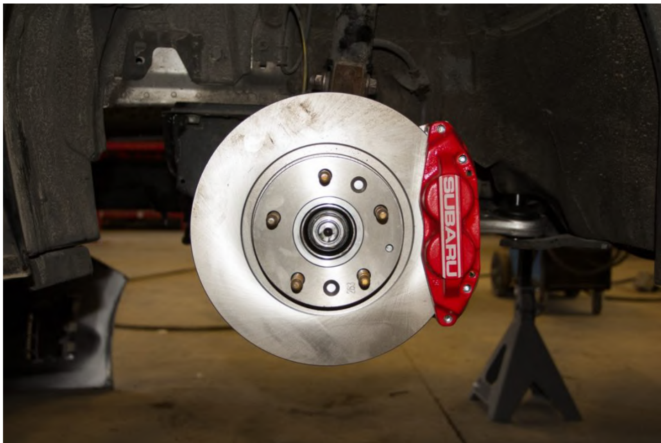
مشخصات لنت ترمز خوب

شاید شما هم بدانید که هر یک از لنت های ترمز دارای معایب و مزایایی هستند. انواع لنت های ترمز مانند سرامیکی ، فلزی و نیمه فلزی و ارگانیک ، دارای مواد متفاوتی هستند که هر یک کارایی متفاوتی از خود نشان می دهند.