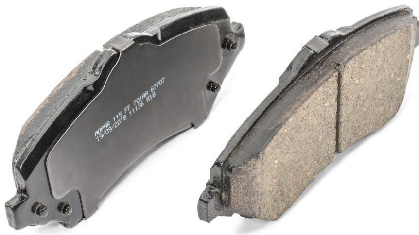
مشخصات لنت ترمز خوب

در همین راستا شهردیک نیز به صورت کامل متمرکز و تخصصی بر روی این قطعه ی خودرو فعالیت می نماید و برندها ی معتبری از بهترین لنت ترمز در بازار را با قیمتی مناسب عرضه می دارد.