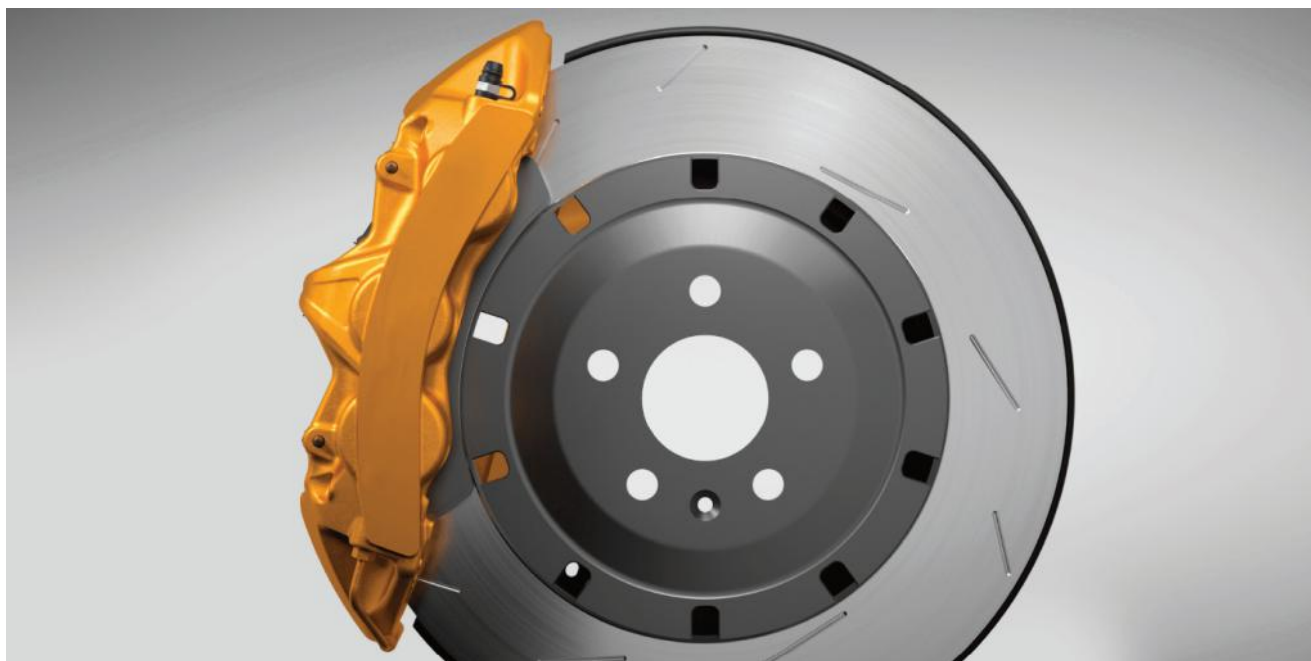
مشخصات لنت ترمز خوب

شاید بتوان گفت برای بررسی مشخصات لنت ترمز خوب می بایست تمامی شرایط را در نظر گرفت و متناسب با خودروی خود، شرایط رانندگی، موقعیت جغرافیایی و ... آن را انتخاب و تهیه کرد.