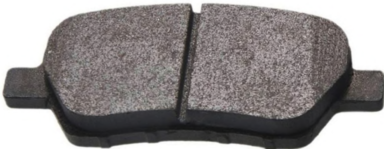
مشخصات لنت ترمز خوب