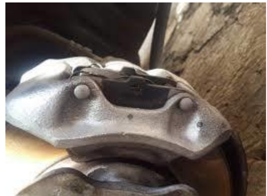
تعویض لنت جلو پراید

نکته: در صورتی که کالیبر لنت ترمز در محل خود به سختی جا جا می‌شد به منظور تعویض لنت جلو پراید با استفاده از سرنگ کمی از مخزن روغن ترمز را خالی کنید و بر بوش کالیبر لنت ترمز بزنید پس از آن کمی شکیبایی کنید تا گیرپاژ و زنگ زدگی کالیبر برطرف شود سپس به آرامی با استفاده از پیچ گوشتی دو سو و وچکش کالیبر لنت ترمز را جلو و عقب کنید تا آزاد گردد.