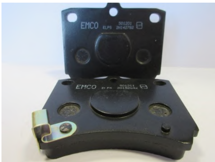
لنت ترمز پراید