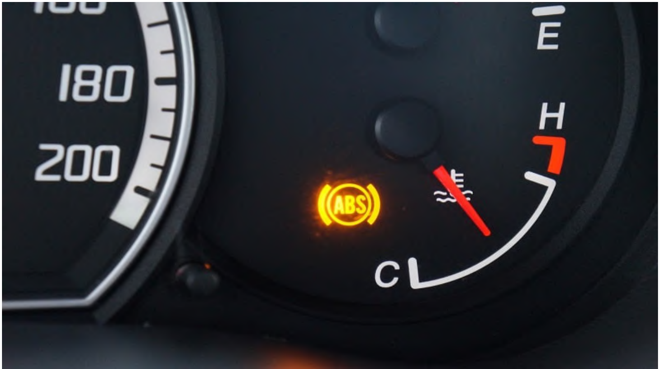
چراغ تعویض لنت

هنگامی که ضخامت لنت ترمز به اتمام می‌رسد سبب می‌شود تا لنت با دیسک تماس پیدا کند و برق نیز عبور کند. پی از اتصال برق چراغ هشداردهنده ترمز روشن می‌شود که به معنای این می‌باشد که عمر لنت ترمز شما به پایان رسیده است.